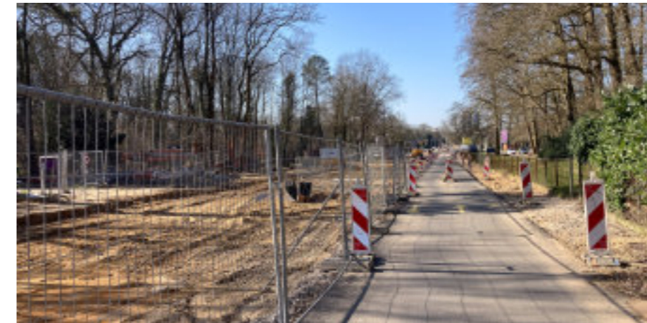
Boven: grondwerk ter hoogte van Regina Pacis, en ruimte voor fietsers en lopers bij Insula Dei.