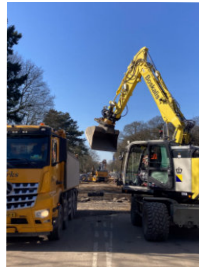
Onder: grondwerk bij Regina Pacis (links), en (rechts) boom planten ter hoogte van de Van der Duyn van Maasdamlaan.