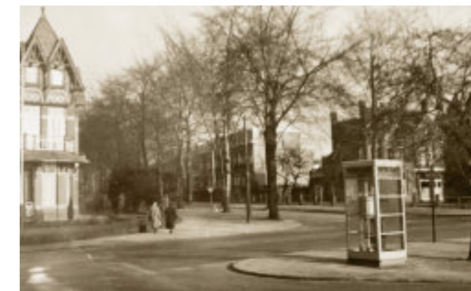
De telefooncel op de splitsing van de Ernst Casimirlaan (nu Velperweg) en (Oude) Velperweg in de jaren vijftig. Tegenwoordig is op deze plek een gazon