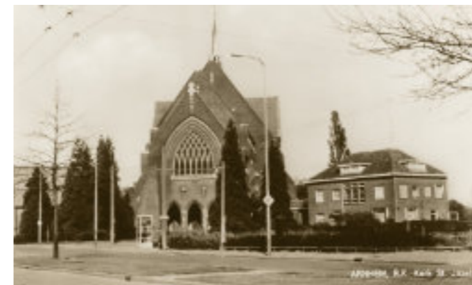
Ansichtkaart St. Jozefkerk met telefooncel op hoek Kloosterstraat.