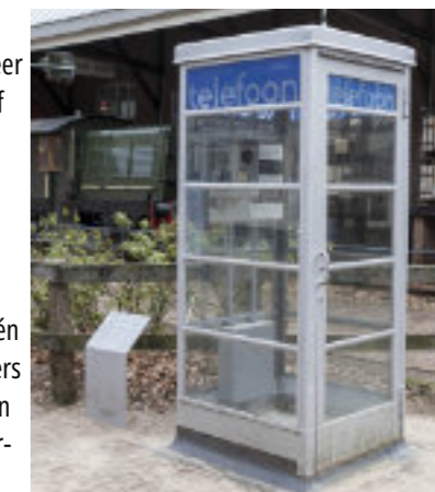
Telefooncel van van de Vlugt (Nederlands Openluchtmuseum, inv.nr. 05.15)

geproduceerd door Gispen. Dit type bleef vanaf 1933 meer dan 50 jaar in gebruik. Vanaf 1965 zijn ze langzaam maar zeker vervangen door het groene, meer vandalismebestendige type. In 2008 werd de wet aangeschaft die bepaalde dat er één telefooncel per 5000 inwoners moest zijn. In 2016 werden in Nederland de laatste vijf verwijderd. Mobiele telefoons maakten ze overbodig. De telefooncel van Van der Vlugt is nu een museumstuk en te zien in het Nederlands Openluchtmuseum (zie foto hier boven), het Rijksmuseum en museum Boijmans van Beuningen.