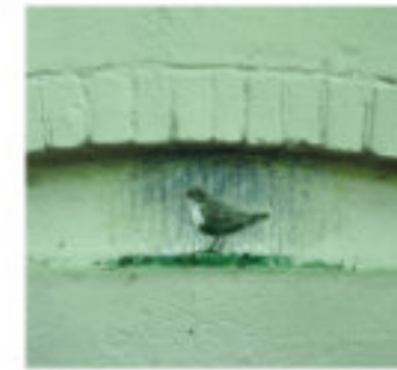
Foto: illustratie van de zeldzame waterspreeuw door Martin vd Oever op de muur van zijn huis

de veelzijdige natuur om hem heen. Hij heeft de bomen groot zien worden en de bosmuizen zien opgroeien. Hij vertelt de kinderen die in het park spelen graag over de dieren en planten die in Angerenstein leven. Hij treedt hiermee in de voetsporen van de heer Houtman door zijn kennis over de natuur te delen.