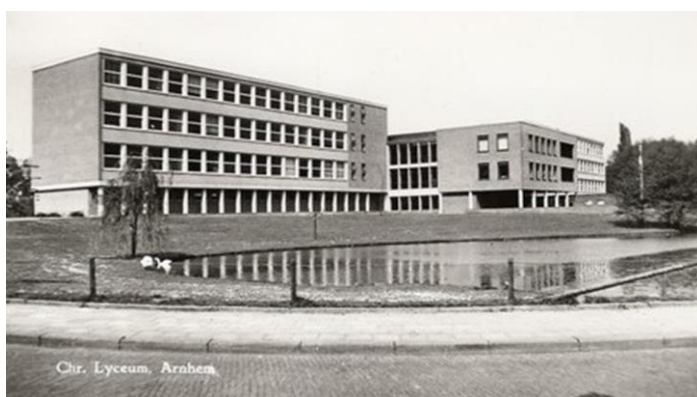
Fig. 7b - Het nieuwe Christelijk Lyceum Arnhem (CLA) in . Enkele jaren later wordt het hoge deel van de beekdalvloer afgedekt met een laag zand voor de bouw van het CLA (geopend in 1964). Het lage venige deel wordt uitgegraven voor de aanleg van de vijver en de oprijlaan van de school.

De sterke kwel in het beekdal lijkt te fungeren als een 'groenblauwe motor', die een snel en krachtig herstel van de unieke natuur mogelijk maakt. Met dit herstel kan de basis gelegd worden voor een schitterend klimaatbestendig en veelzijdig Beekdal, waar de bewoners van de omliggende wijken van kunnen genieten.