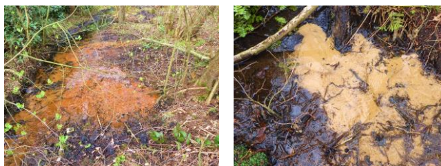
Fig. 2a - Het overal in het Beekdal omhoog borrelend kwelwater heeft een constante temperatuur van 8-9 °C, is zuurstofarm, maar relatief rijk aan nutriënten. Kwelwater bevat ook veel ijzer, dat bij uittreding oxideert en neerslaat als roodbruin ijzerhydroxide. Hieruit ontwikkelt zich na verloop van tijd door uitdroging en verharding ondoorlatend ijzeroer .

(Fig. 2a en 2b). Dit alles lijkt erop te wijzen, dat de Paasbergbeek niet een door mensen gegraven sprengenbeek is, maar een kwelbeek gevoed door natuurlijke bronnen.