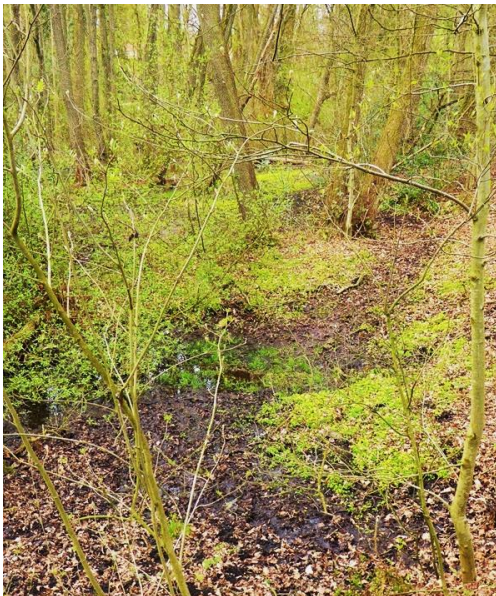
Fig. 1 - Elzenbronbos bij het Beekdal Lyceum op permanent nat kwelveen; de vegetatie bestaat uit goed ontwikkeld Elzenbronbos met zwarte els, gewone vogelkers en hulst; dichte kruidenlaag met o.a. Goudveil en Lidrus.

Op 8 april is het Beekdalproject officieel van start gegaan met een eerste bijeenkomst in het Beekdal Lyceum. Hierbij waren vertegenwoordigers van sportclubs en andere betrokken partijen aanwezig, evenals de verantwoordelijke wethouders Bob Roelofs (Sport) en Cathelijne Bouwkamp (Klimaatadaptatie, Groen en Stedelijke Ontwikkeling). Tijdens de bijeenkomst werden verschillende mogelijkheden verkend voor een klimaatbestendige, duurzame