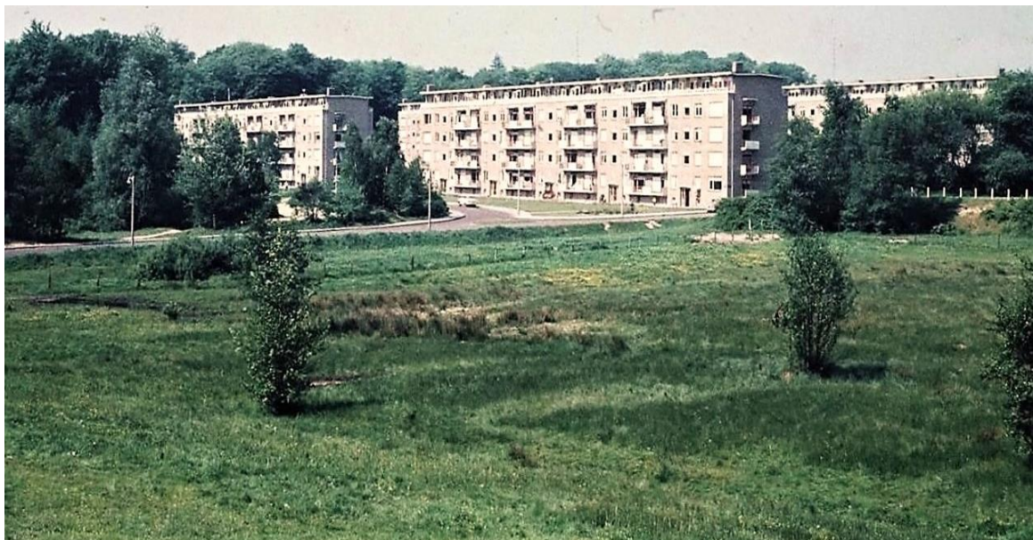
Fig. 7a - Het Beekdal eind jaren '50. De foto is genomen direct na de bouw van de flats van Angerenstein-Noord, maar vòòr de bouw van het CLA. Nog steeds is het oude drainage-patroon van dwarsloten goed te zien ondanks gedeeltelijke overwoekering door vegetatie.

Deze korte verkenning bevestigt het vermoeden dat het Beekdal deel uitmaakt van een brede natte kwelveenzone. Een gebied dat zijn ecologische veerkracht niet heeft verloren, ondanks de vele forse ingrepen zoals het uitgraven van vijvers en opspuiten met bouwzand.