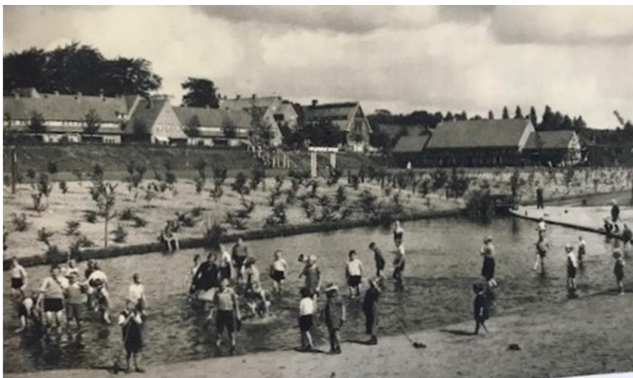
Fig. 6 - Het zwembad in het dal van de Vondellaan werd gegraven in de jaren '30.

Vondellaan, dat toegankelijk was voor alle buurtbewoners (Fig. 6).