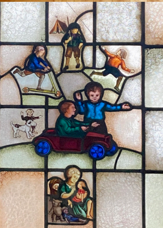
Glas-in-loodraam in de vroegere kinderkamer