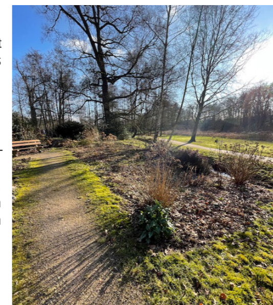
Olga's hobby-tuin nu nog in winterslaap ...

Tekst: Jasper Neyssen & Elise Baartman