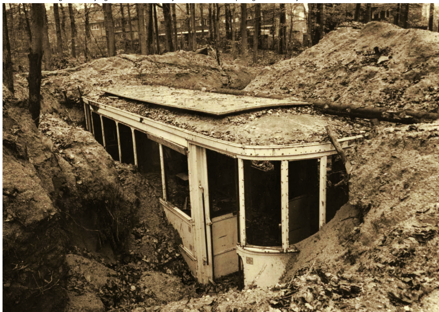
Het uitgraven van bijwagens als schuilkelder nabij Rennen Enk aan de Velperweg.