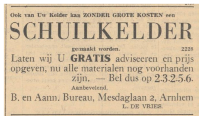
Arnhemsche courant, 12-04-1939.