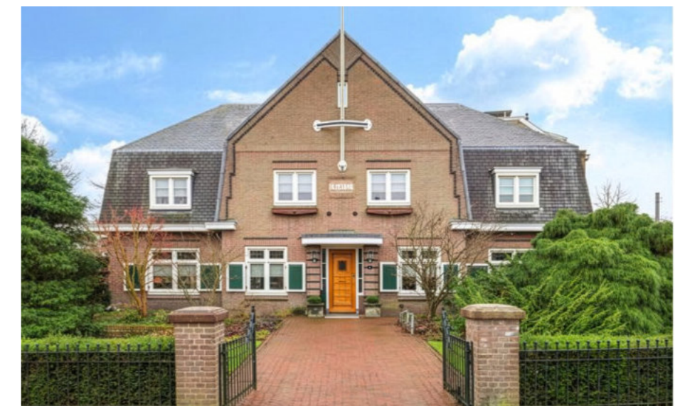
Het huis "de Heurne" op de hoek Huijghenslaan en Rosendaalseweg