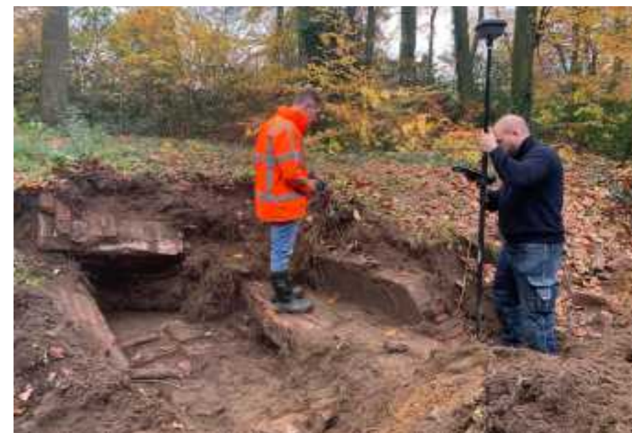
Restanten van de ijskelder worden met de GPS nauwkeurig ingemeten.

De eerste vraag kon met behulp van het onderzoek positief worden beantwoord. Op de plaats waar inwoners van de wijk de ijskelder vermoedden, werd deze ook aangetroffen. Tot circa 1960 was de ingang nog goed zichtbaar. Een wijkbewoner die in deze periode de kelder binnen is gegaan, kon de archeologen van waardevolle informatie voorzien. Van de ijskelder wordt gedacht dat deze aan het einde van de 19e