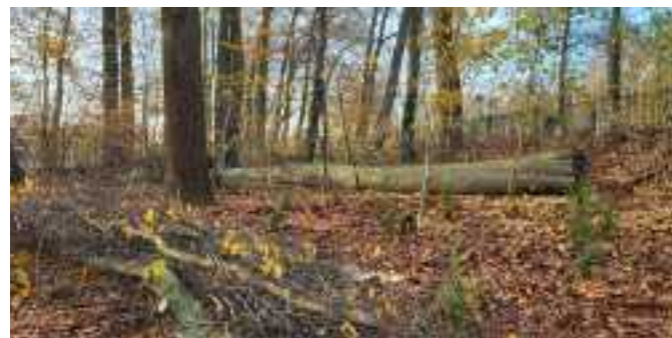
Biodivers bij hek Roosendaalseweg

Bij het schrijven van dit stukje staan de krokussen in bloei (zie cover van deze wijkkrant). De reigers bouwen hun nesten onder luid gekrijs en de specht en de bosuil laten zo nu en dan ook van zich horen. Het voorjaar is begonnen; het park ontwaakt!